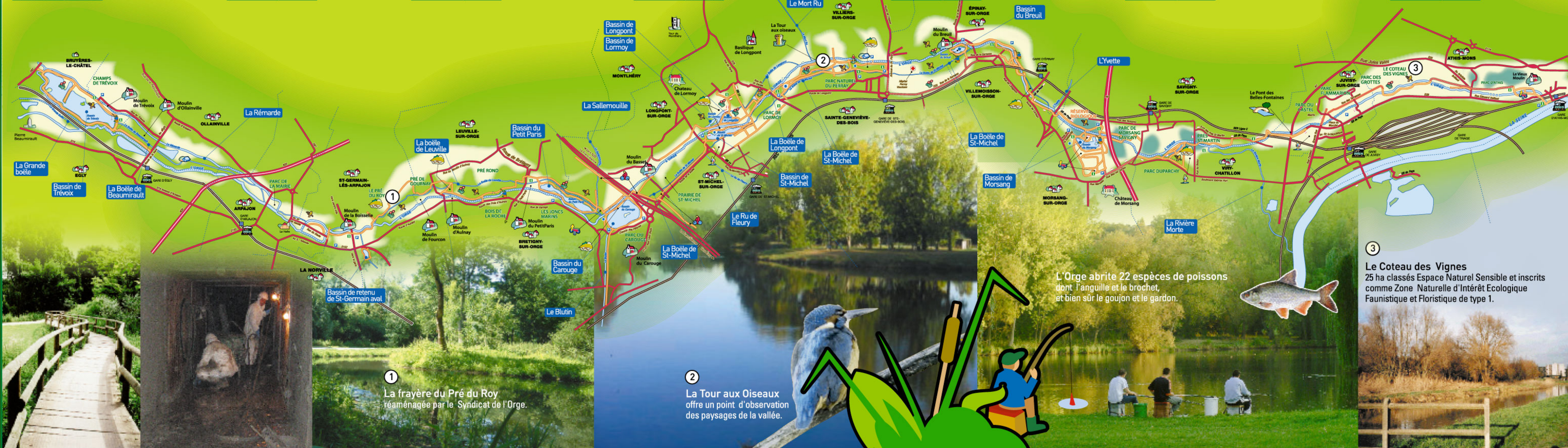
1 La frayère du Pré du Roy réaménagée par le Syndicat de l'Orge.